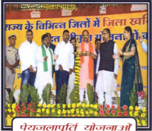
पेयजलापूर्ति योजनाओं का शिलान्यास